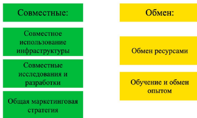
Рис. 2. Условия взаимодействия между предприятиями в рамках промышленных симбиозов.

Взаимодействие между предприятиями в рамках промышленных симбиозов может быть взаимовыгодным для всех участников, способствовать устойчивому развитию и созданию конкурентных преимуществ, что может осуществляться через совместное использование ресурсов или внедрение стратегий, или же через обмен, как представлено на рисунке 2.