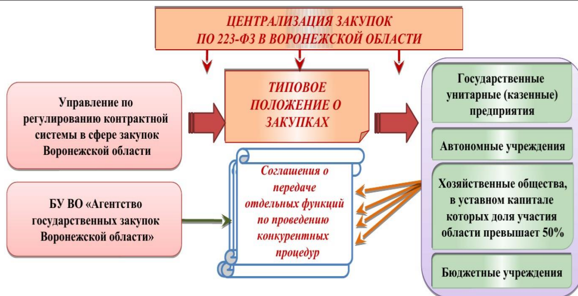
Рис. 1. Централизация закупок в Воронежской области по Федеральному закону № 223-ФЗ

Частичная централизация закупок (ч. 3 ст. 26 Закона № 44-ФЗ — централизации подлежат закупки не всех, а только определенной части заказчиков — органов исполнительной власти, казенных и бюджетных учреждений), практически не встречается в субъектах РФ, но все же примеры имеются (например, Республика Адыгея).