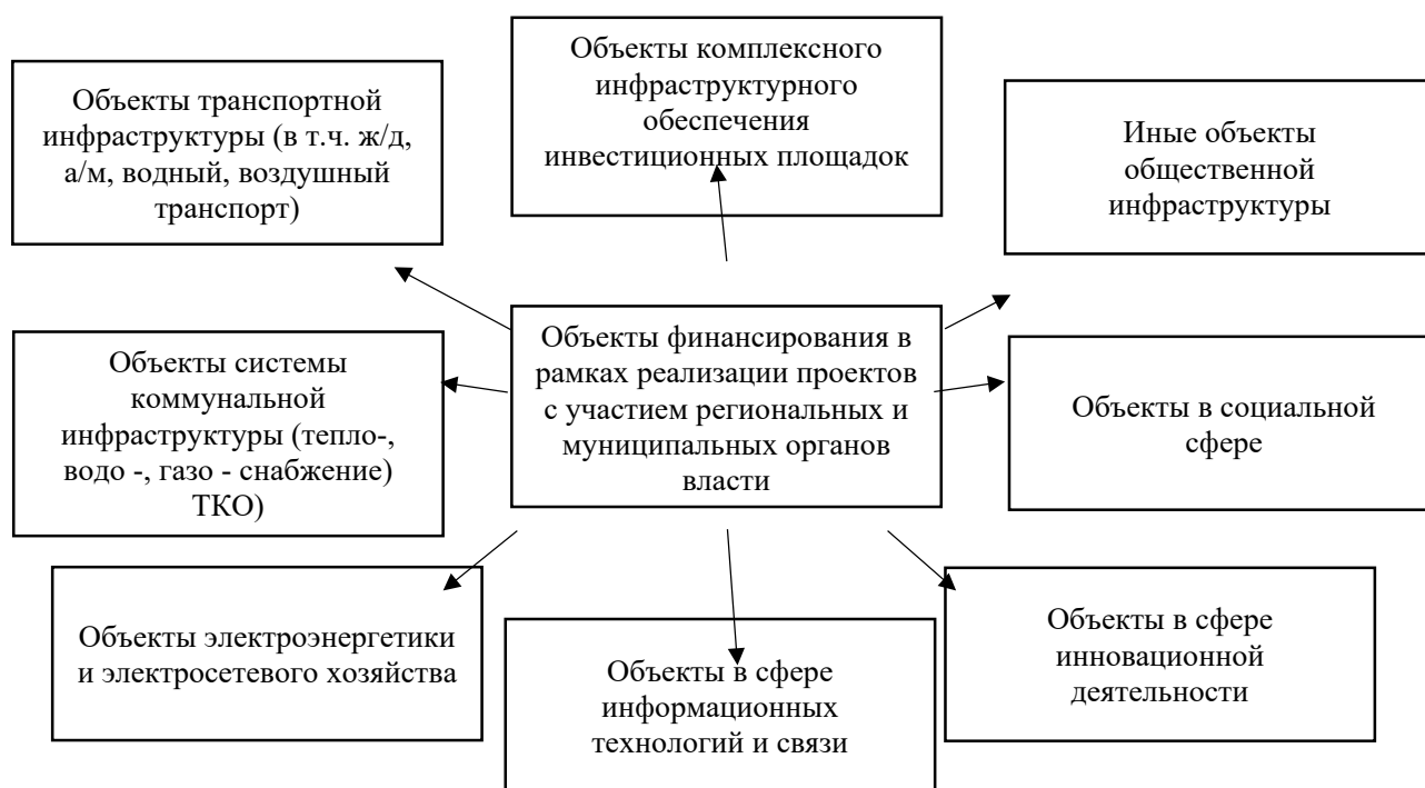
Рис. 3. Классификация региональных инвестиционных проектов с участием государственных и муниципальных органов власти с точки зрения объекта воздействия [6, 7]

Грамотное и качественное претворение в жизнь региональных инвестиционных проектов не представляется возможным без раскрытия инвестиционного потенциала региона, который предопределяет дальнейший социально-экономический рост, перспективы эффективного развития экономики и инноваций.