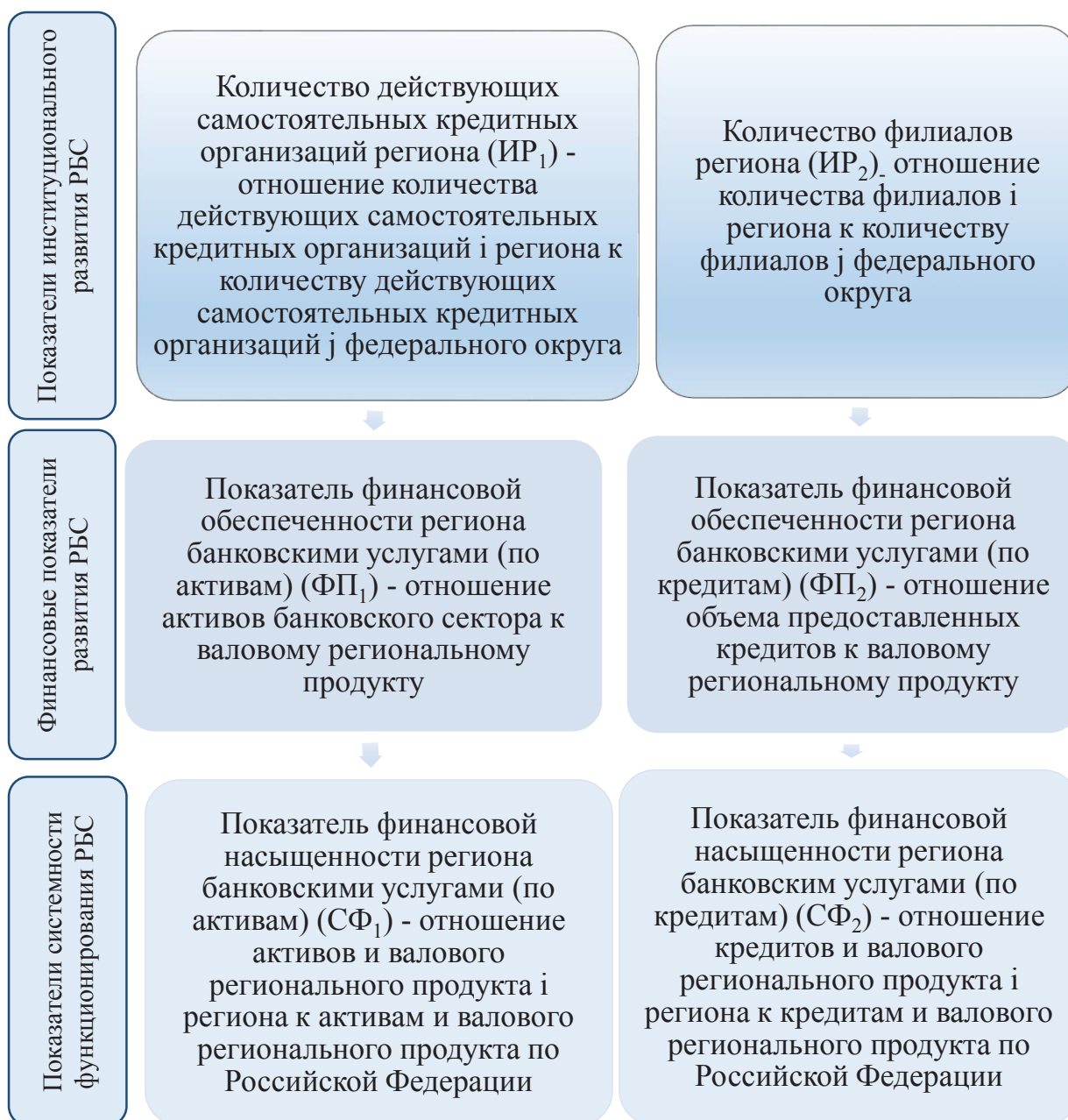
Рис. 2. Характеристика показателей, входящих в состав комплексного интегрального показателя оценки устойчивости РБС

— сводный индекс системности функционирования региональной банковской системы ( I_{СФ} ) — корень квадратный из произведения показателя финансовой насыщенности региона банковскими услугами (по активам) и показателя финансовой насыщенности региона банковскими услугами (по кредитам).