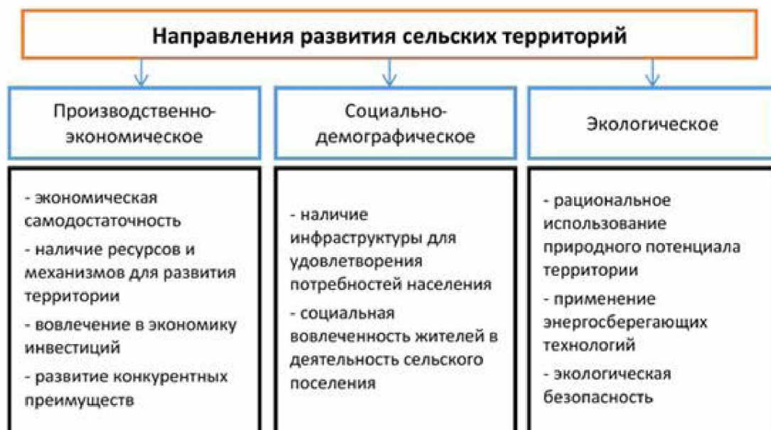
Рис. 1. Современные направления развития сельских территорий [13, 17]

льным для сельской местности России в целом. Но даже в развитых аграрных регионах уровень жизни в сельской местности находится значительно ниже уровня жизни, чем в городской местности. В научной литературе ведется активное обсуждение возможных направлений и результатов развития сельских территорий (см. рис. 1 и 2), однако сложившаяся ситуация очень мало поддается каким-либо позитивным изменениям.