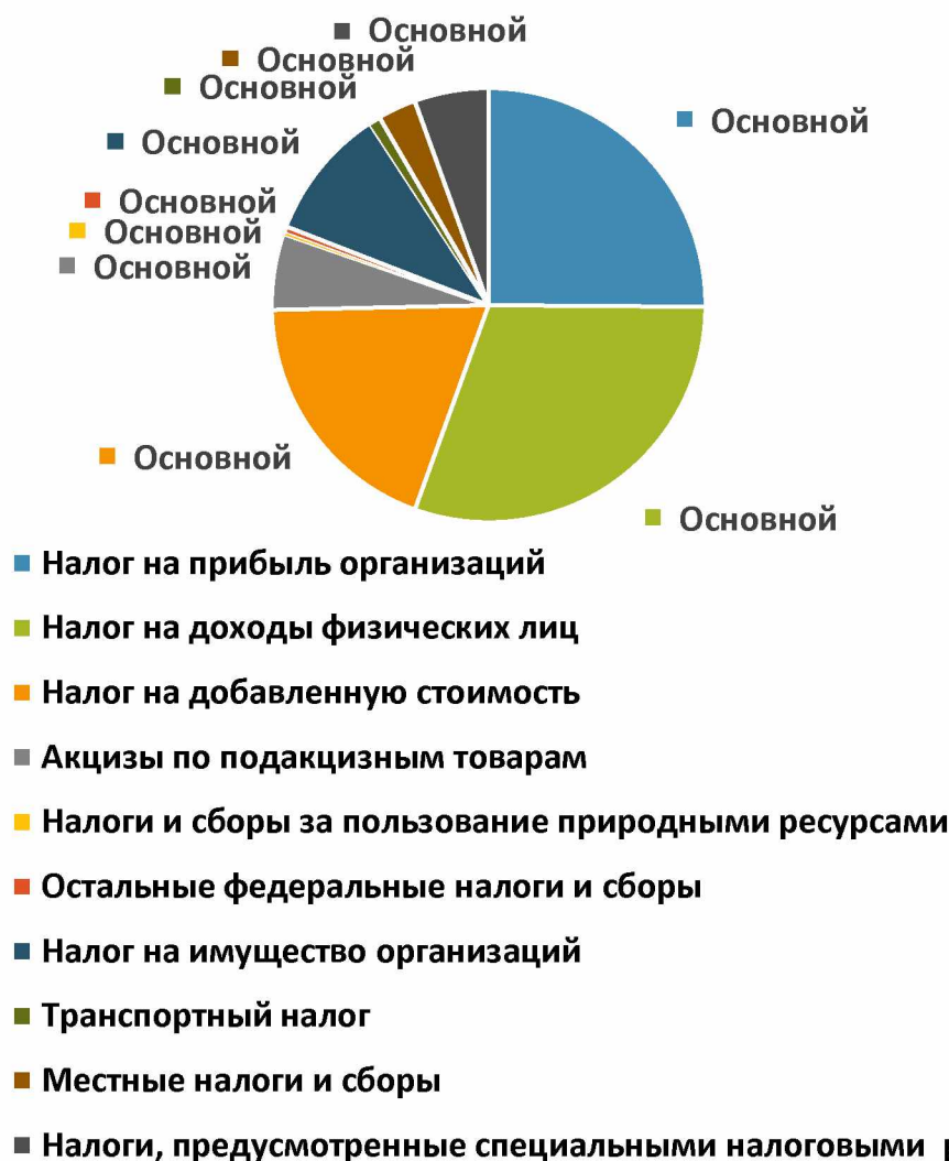
Рис. 2. Структура налоговых поступлений в консолидированный бюджет РФ от налогоплательщиков Воронежской области за 2016 год (по видам налогов)

На основании представленной структуры налоговых поступлений (рис. 3) можно сделать вывод о том, что за год их распределение существенно не изменилось (аналогично периоду времени с 2015 по 2016 гг.). В 2017 году в консолидированный бюджет РФ от налогоплательщиков Воронежской области так же был зачислен налог на доходы физических лиц в наибольшем объеме (в процентном отношении его количество составляет 30,73 % от всего объема платежей в казну государства). В свою очередь, следующими по убыванию так и остались налог на прибыль организаций — 23,82 % от общего объема уплаченных средств и налог на добавленную стоимость — 21,23 % (только у данного вида налога заметен небольшой прирост, составляющий примерно