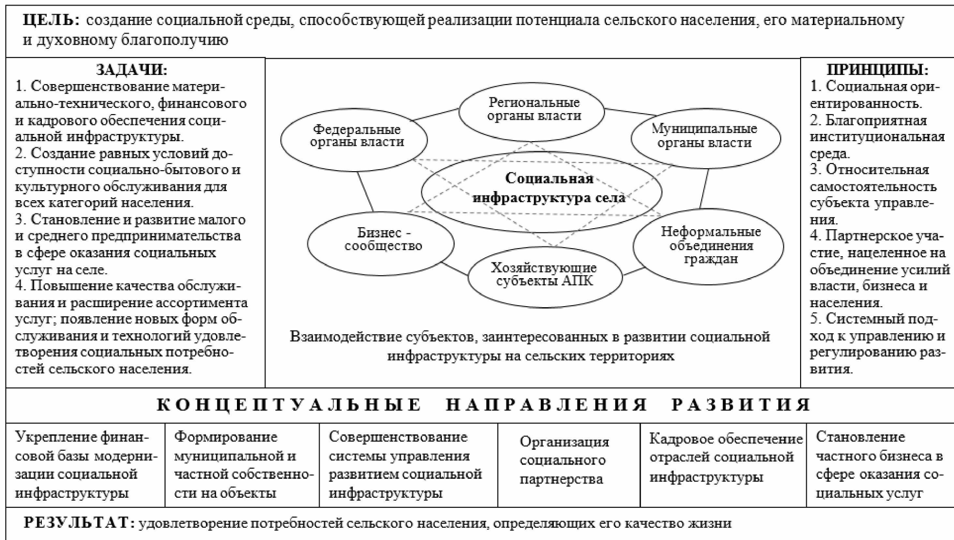
Рис. 2. Концептуальная модель формирования и развития социальной инфраструктуры на сельской территории