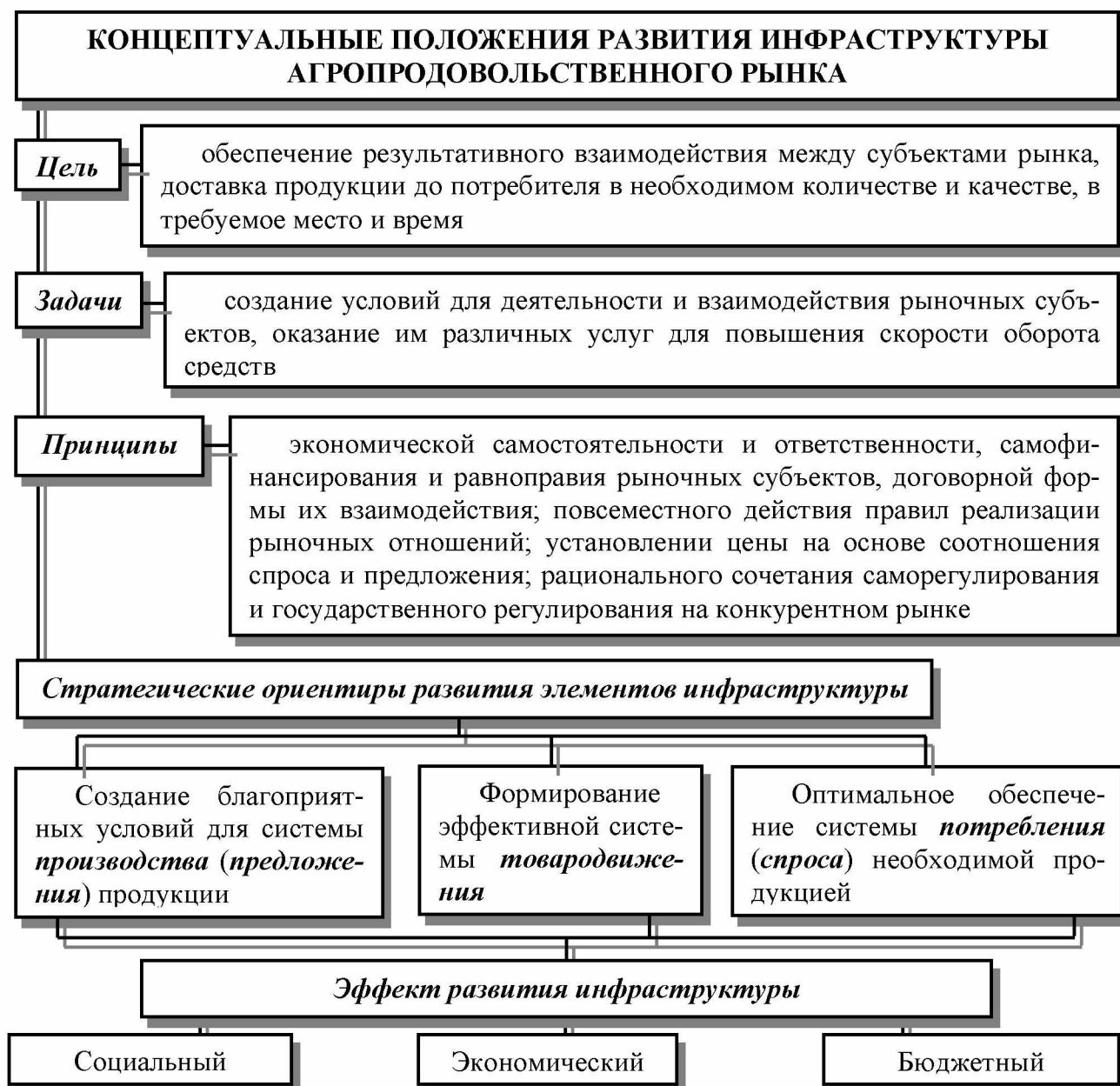
Рис. 1. Концептуальные положения развития инфраструктуры агропродовольственного рынка

Многофункциональный характер элементов инфраструктуры позволяет практически каждому из них участвовать в процессе создания необходимых условий для производства, потребления и товародвижения продукции. Это является основанием для деления элементов на общие и специфические.