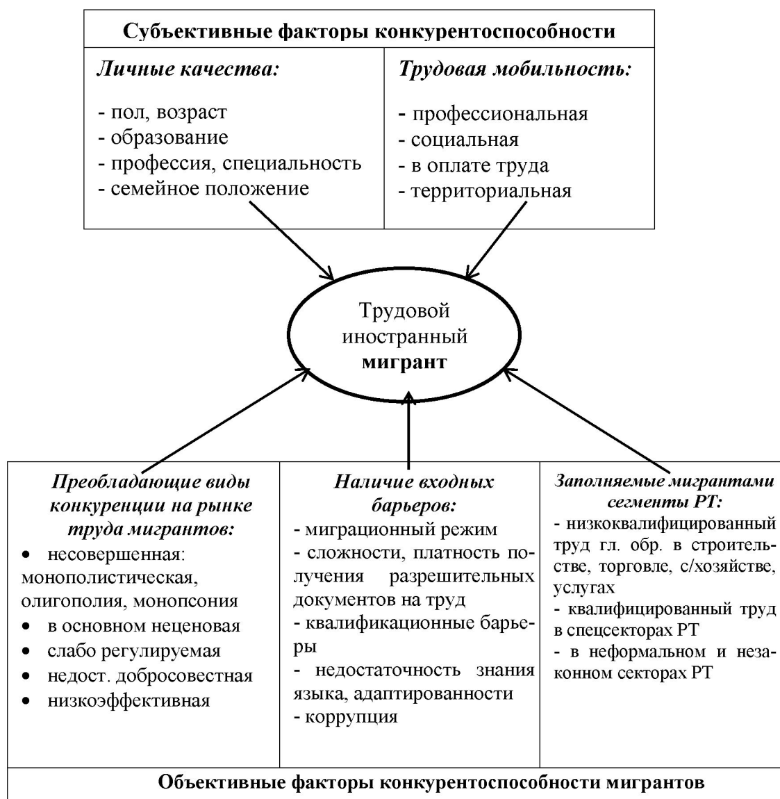
Рис. 1. Основные факторы конкурентоспособности иностранных трудовых мигрантов на российском рынке труда

На основе сравнительного анализа ряда публикаций о положении на рынке труда и конкуренции российских работников и иностранных мигрантов [7] основные факторы конкурентоспособности внешних трудовых мигрантов на рынке труда России можно рассмотреть в более развернутом виде. Исходя из этого анализа, мы попытались сделать на его основе ряд обобщений (таблица).