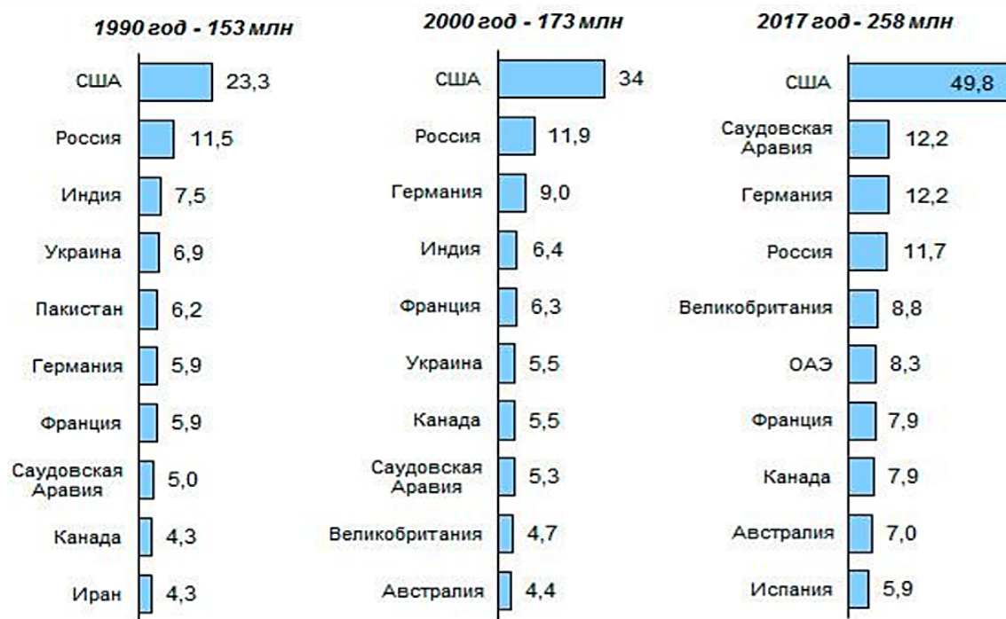
Рис. 1. Десять стран, в которых проживало наибольшее число международных мигрантов на середину 1990, 2000 и 2017 годов, миллион человек [4]

В 2017 г. Саудовская Аравия заняла второе место по числу проживающих в ней мигрантов, несмотря на то, что с 2000-х годов государство активно противостояло наплыву мигрантов и не раз проводило массовую депортацию. Иммиграция в объеме 12,2 млн человек была обеспечена в основном за счет трудовой миграции из Индии, Пакистана, Бангладеш, Египта, Филиппин. В отношении России, в 2017 г. в сравнении с 2000 г. опустившейся на 2 позиции, количество иностранных мигрантов сократилось на 0,2 млн человек. Германия в 2017 г. занимала 3 место по числу иммигрантов. Количество иностранных мигрантов в 2017 г. в Германии выросло на 3,2 млн человек по сравнению с 2000 г. вследствие продолжавшейся либеральной политики в пользу мигрантов. Австралия проводила миграционную политику, на основе которой в первую очередь в страну принимались иммигранты, осуществляющие инвестиции в экономику страны. Данная политика, актуальная в этой стране сегодня, обеспечивает ежегодный прирост иммигрантов в размере 1,6 %. Это более чем в два раза превышает темпы ежегодного миграционного прироста населения США (0,7 %) и Великобритании (0,6 %), а также выше темпов роста Филиппин и Сингапура (1,5 %).