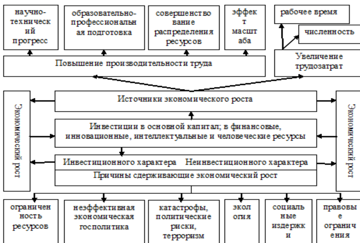
Рис. 1. Влияние инвестиций на ускорение и замедление экономического роста

По нашему мнению, последний критерий имеет решающее значение при отборе «точек экономического роста», так как инвестиции выступают в качестве основного регулятора динамики экономического роста, причем как в качестве инструмента, стимулирующего ускорение темпов, так и формирующего причины, сдерживающие экономический рост (рисунок 1).