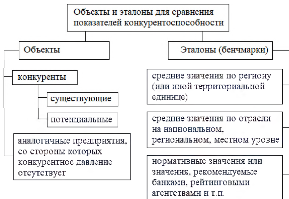
Рис. 1. Выбор объектов или эталонов для сравнения показателей, характеризующих конкурентоспособность компании

Проведение сопоставления со всеми доступными объектами нередко становится слишком трудоемким, а выбор отдельных примеров требует обоснования и тщательной оценки: