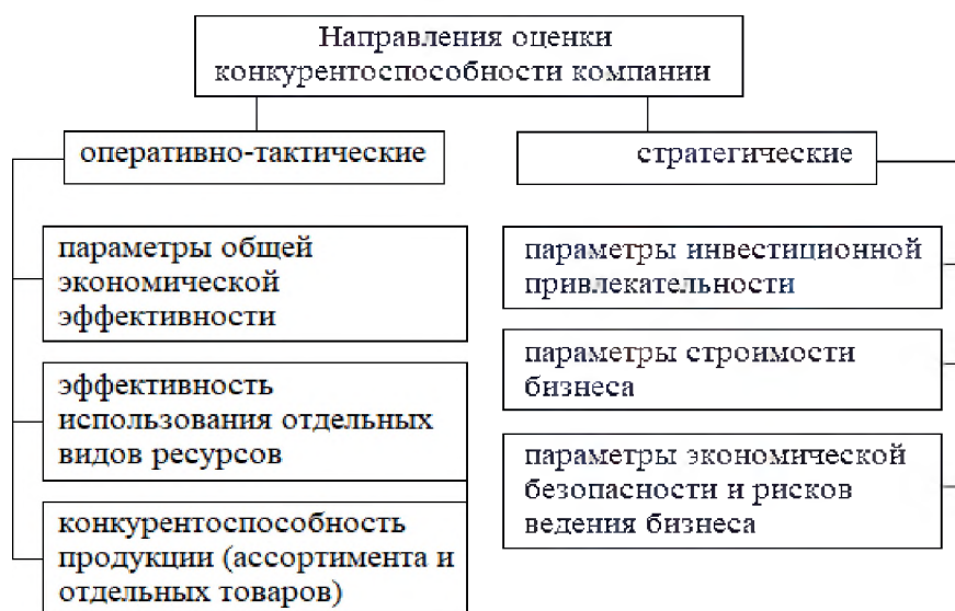
Рис. 2. Направления оценки конкурентоспособности компании

Необходимо также сформировать набор показателей для сравнения и выявления уровня конкурентоспособности. По сути, почти любые параметры работы, если они превосходят параметры других компаний, могут прямо или косвенно указывать на более высокий уровень конкурентоспособности и более сильную конкурентную позицию, но можно и сформировать несколько основных направлений для оценки (рис. 2).