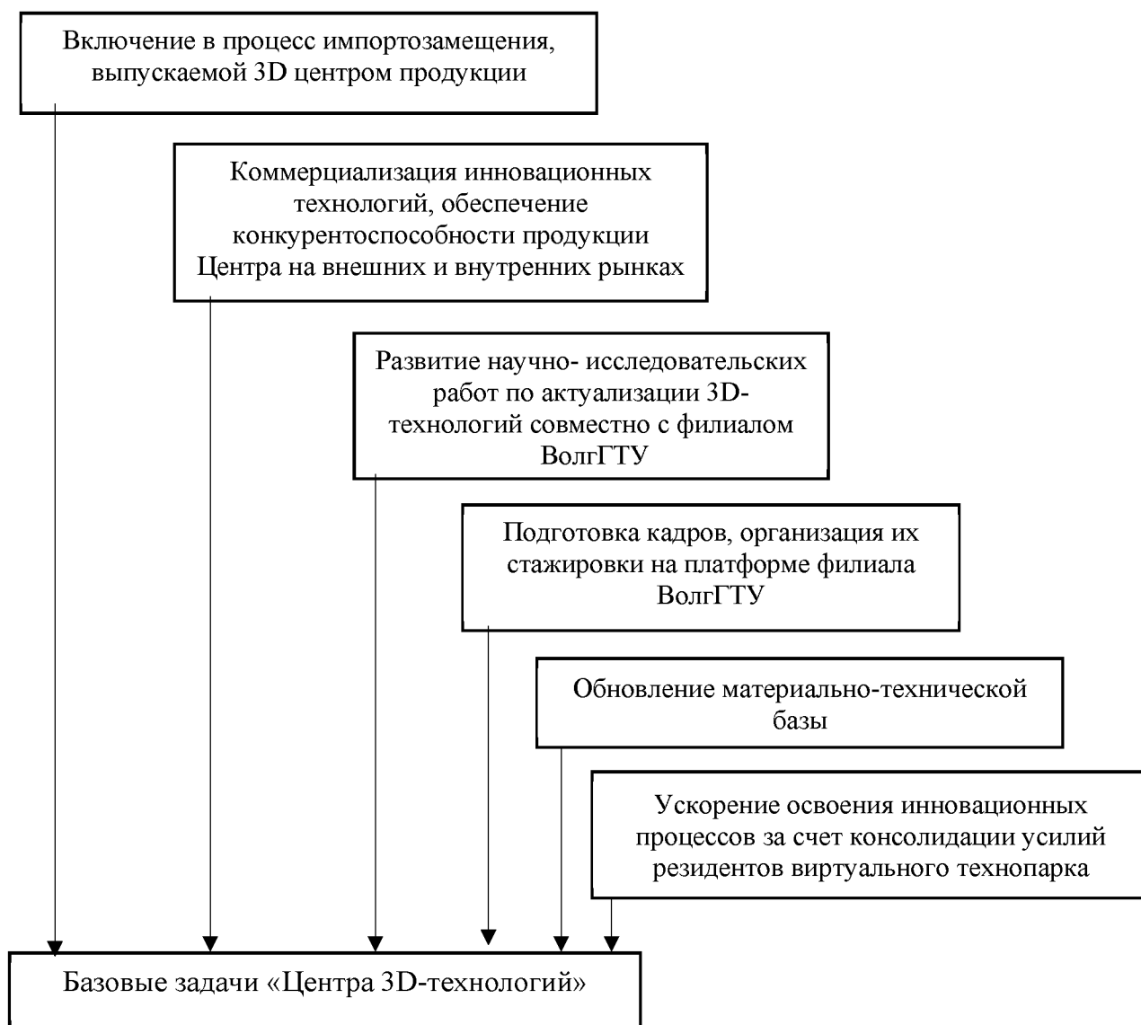
Рис. 3. Базовые задачи «Центра 3D-технологий» как субъекта малого предпринимательства

В формате технопарка используется значительное число институтов поддержки: технологическое (компании из сферы IT, фармацевтики, химического производства, приборостроения, производства оборудования), креативная индустрия, технологии для образования и непосредственно институты развития и поддержки бизнеса. В целом организованное пространство подразумевает взаимодействие предпринимателей-производственников на разных стадиях развития бизнеса. Например, стартапер начинает развивать свой продукт и представляет его на дискуссионной площадке в «Точке кипения — Санкт-Петербург», где на него может обратить внимание крупный бизнес или резиденты технопарка. На территории технопарка сконцентрировано самое большое число институтов поддержки и развития бизнеса: