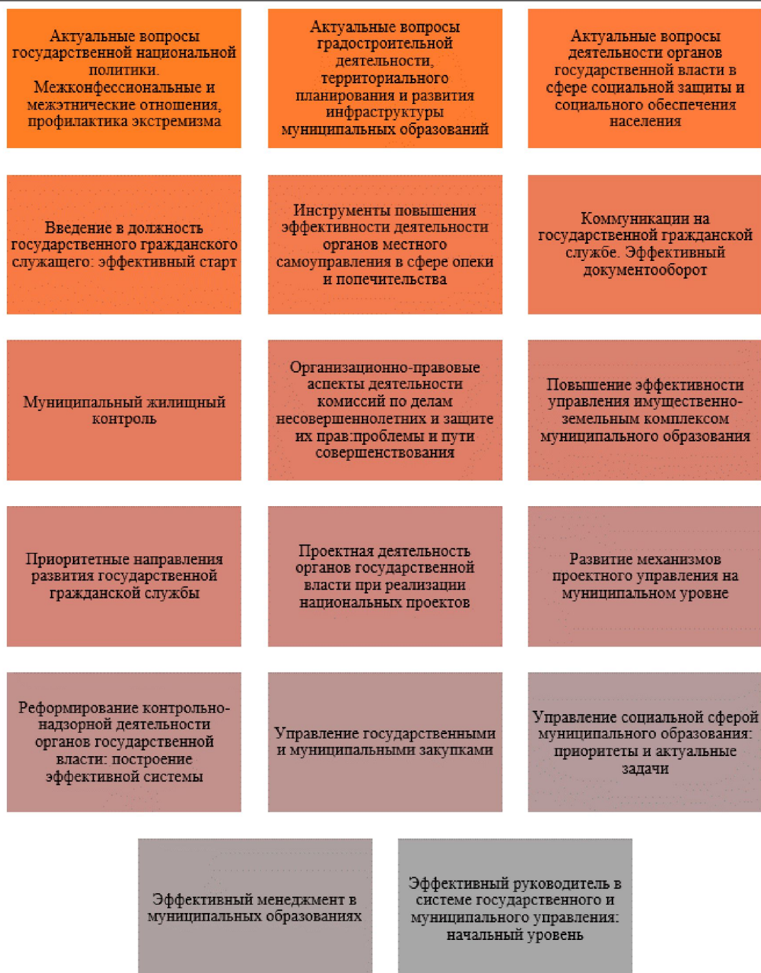
Рис. 2. Программы повышения квалификации АУ «Корпоративный университет Правительства Воронежской области»

Из рисунка видно, что перечень программ повышения квалификации КУШНО не предусматривает программ, направленных на совершенствование цифровых компетенций кадров органа власти, что может свидетельствовать о таком недостатке в системе профессионального развития кадров Правительства Воронежской области, как отсутствие в базе программ повышения квалификации АУ «Корпоративный университет Правительства Воронежской области» программ, направленных на овладе-