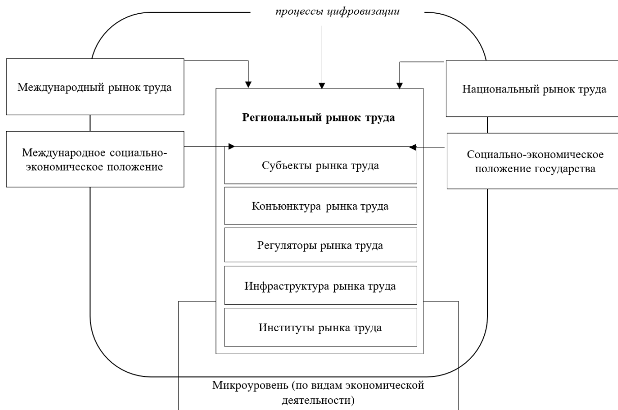
Рис. 1. Схематичное изображение содержания Концепции обеспечения экономической безопасности рынка труда