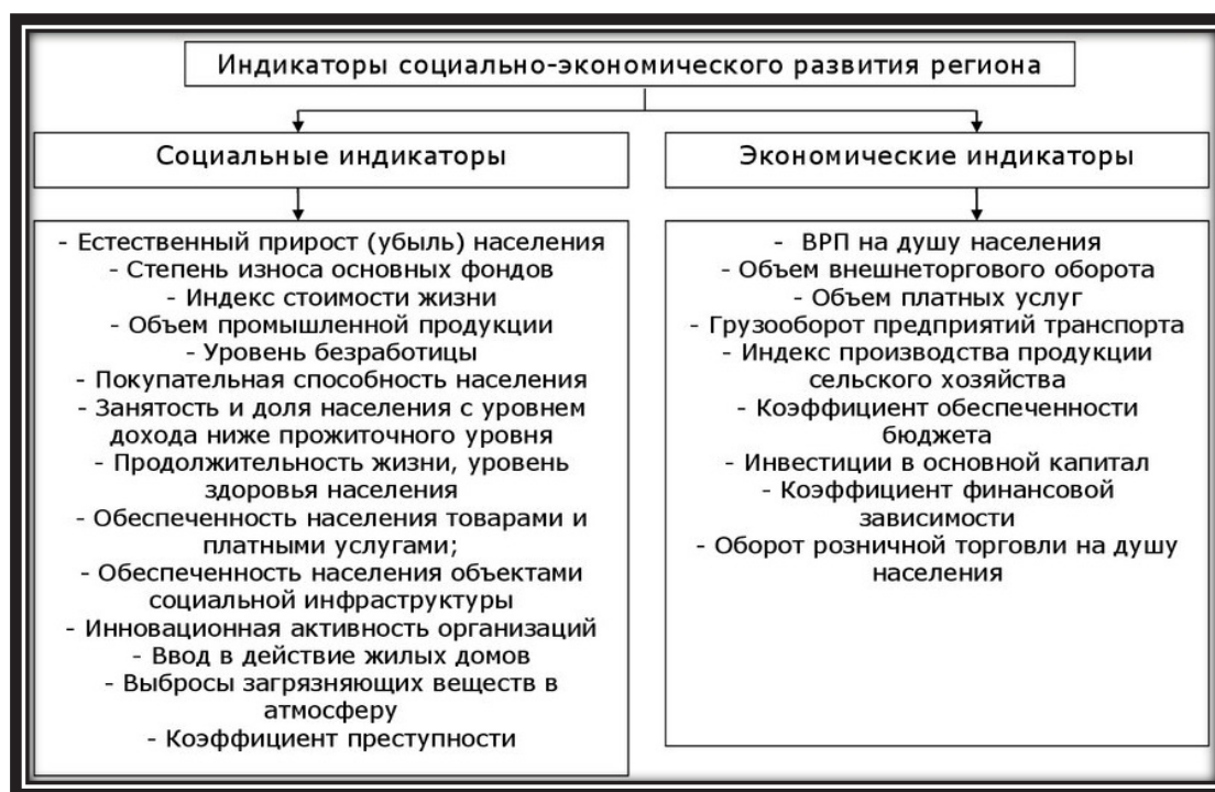
Рис. 1. Классификация индикаторов социально-экономического развития региона

На рисунке 1 представлены возможные индикаторы, характеризующие социально-экономическое развитие региона [11, с. 1906].