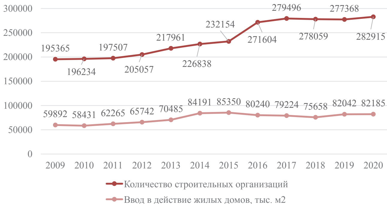
Рис. 2. Динамика количества строительных организаций и ввода в действие жилых домов, тыс. м (составлено авторами на основании данных [7])

Следующим показателем является среднегодовая численность работников строительных организаций. В основном он показывал рост по сравнению с прошлым годом, однако в 2013 и 2016 годах наблюдалось сокращение численности работников отрасли. В целом, с 2009 по 2020 гг. среднегодовая численность работников увеличилась на 1406,4 тыс. чел.