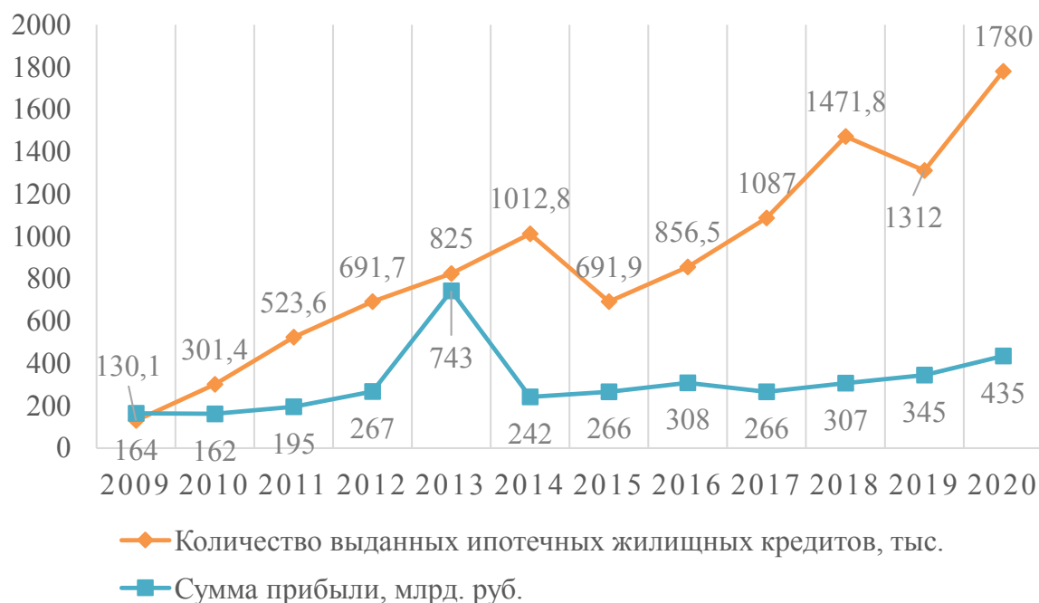
Рис. 5. Динамика количества ипотечных жилищных кредитов, тыс. и суммы прибыли строительных организаций, млрд руб. (составлено авторами на основании данных [7])