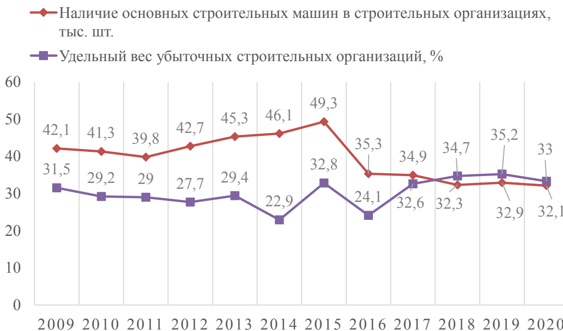
Рис. 4. Динамика наличия основных строительных машин в строительных организациях, тыс. шт. и удельного веса убыточных строительных организаций (составлено авторами на основании данных [7])

С 2009 по 2020 гг. удельный вес убыточных строительных организаций увеличился на 1,5 %. В 2019 году наблюдается наибольшее количество убыточных строительных организаций за рассматриваемый промежуток времени. Это связано со сложностями при переходе на систему эскроу-счетов, ухудшением ситуации на рынке и падением платежеспособного спроса [4]. В 2020 году произошло сокращение убыточных организаций на 2,2 % по сравнению с предыдущим годом.