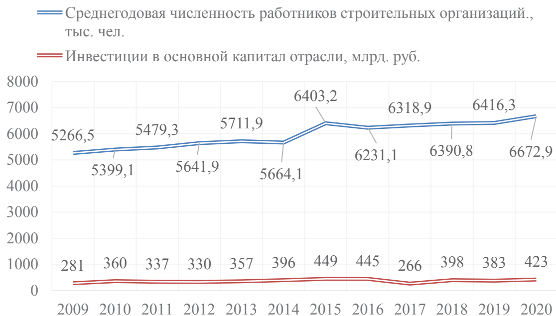
Рис. 3. Динамика среднегодовой численности работников строительных организаций, тыс. чел. и инвестиций в основной капитал отрасли, млрд руб. (составлено авторами на основании данных [7])

Инвестиции в основной капитал строительной отрасли за 2020 год составляет 422 801,1 млн руб., что по сравнению с 2009 годом больше на 141 400,4 млн руб. (Рис. 3). Самый малый приток инвестиций наблюдался в 2017 году, что связано с изменением уровня доходов населения, в результате чего произошло ослабление инвестиционной активности на рынке недвижимости.