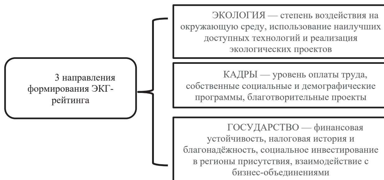
Рис. 2. Направления формирования ЭКГ-рейтинга

В ЭКГ-рейтинг включены субъекты предпринимательской деятельности, прошедшие оценку по трем направлениям (рис. 2) [6].