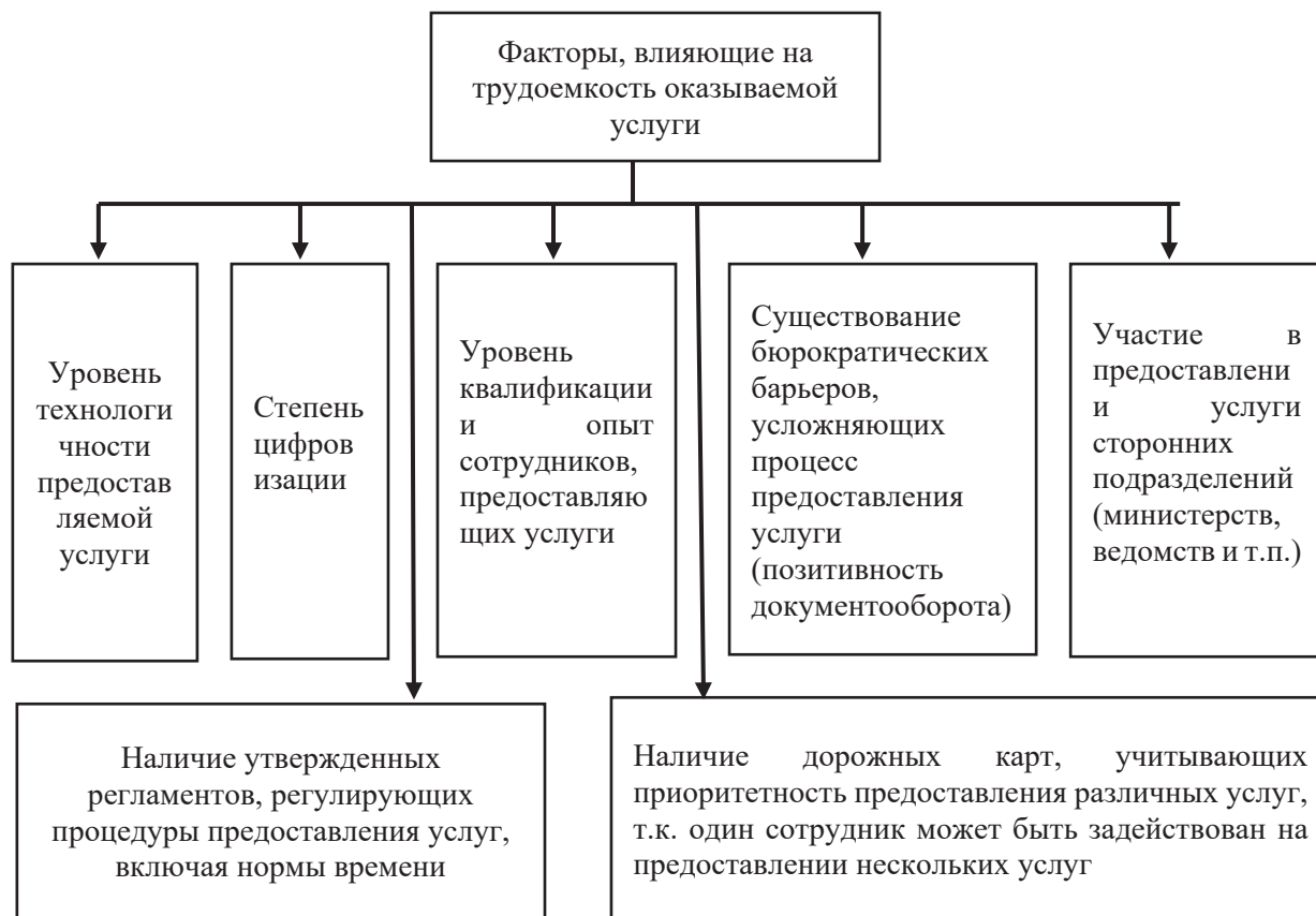
Рис. 1. Факторы, оказывающие влияние на трудоемкость предоставляемых услуг

Наиболее подвижным показателем, на динамику которого могут оказывать влияние учреждения социальной сферы, является трудоемкость. Нами проведён компаративный анализ влияния совокупности факторов на трудоемкость оказываемых услуг (рис. 1).