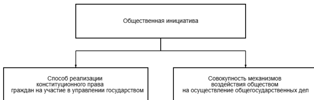
Рис. 1. Понятие общественной инициативы [2]

По мнению Г. Ш. Ибрагимовой, общественная инициатива — это «способ реализации конституционного права граждан на участие в управлении государством, а также совокупность механизмов воздействия обществом на осуществление общегосударственных дел» [2] (рис. 1).