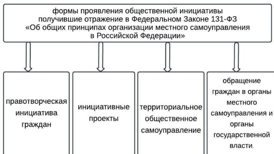
Рис 3. Формы проявления общественной инициативы, получивших отражение в Федеральном законе 131-ФЗ

Основные формы проявления общественной инициативы представлены на рис.3.