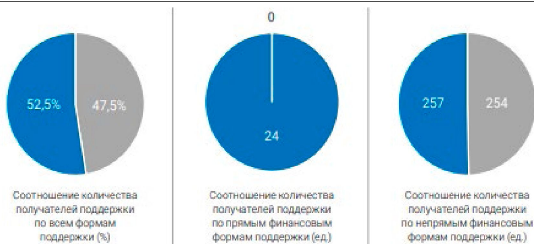
Рис. 3. Соотношение количества МСП, поддержанных на региональном и федеральном уровнях в 2022 г. в Республике Саха (Якутия)

На рисунке 3 региональные меры поддержки МСП обозначены синим цветом, федеральные — серым, из чего можно сделать вывод, что наибольшую поддержку в 2022 г. по всем формам получили субъекты малого и среднего предпринимательства из регионального бюджета (52,5 %), из них: прямая финансовая поддержка полностью обеспечена за счет бюджета региона (24 формы поддержки), непрямая финансовая поддержка оказывалась примерно одинаково, как региональным бюджетом (257 ед.), так и федеральным (254 ед.).